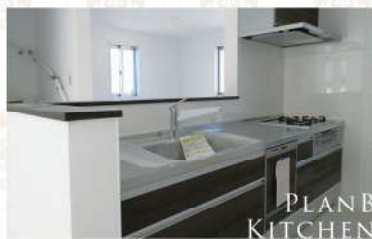
PLAN B KITCHEN