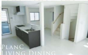
PLAN C LIVING DINING