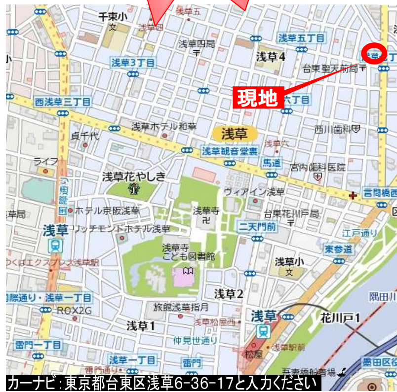
カーナビ: 東京都台東区浅草6-36-17と入力ください